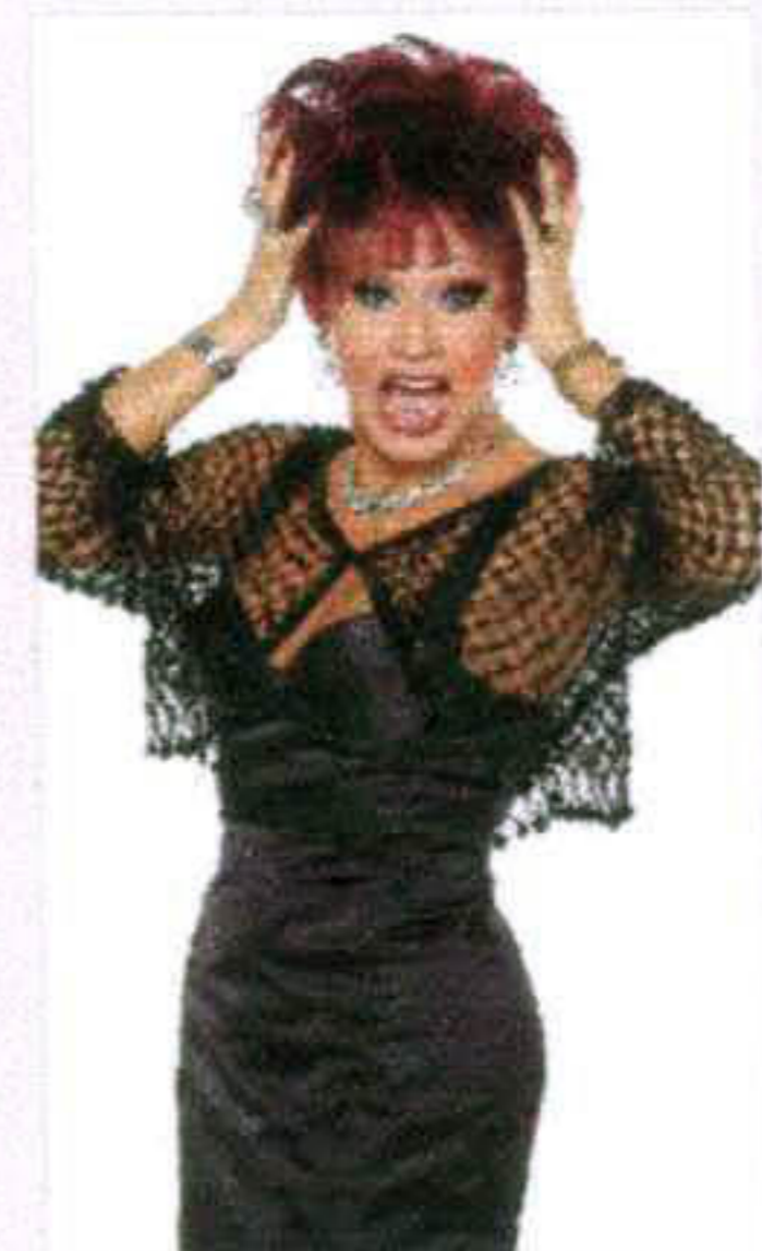
A atriz é sinônimo de bom humor

maneira bem humorada e inteligente, marca registrada de sua verve profissional. Os convites custam R$50 (inteira) e R$25 (meia-entrada). A Sala Acrísio Camargo fica na Av. Eng. Fábio Roberto Barnabé, 3.665, Jardim Regina, Indaiatuba, SP. Mais informações pelo telefone (19) 3834-7837 e www.teatrogt.com.br